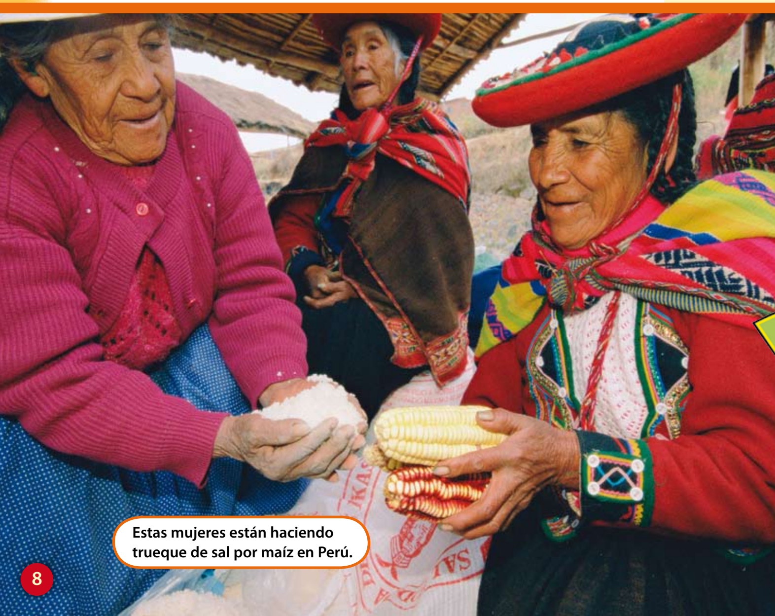
Estas mujeres están haciendo trueque de sal por maíz en Perú.

La primera forma de comercio fue el trueque. El trueque es cuando se intercambian bienes y servicios. No se usa dinero en el trueque.