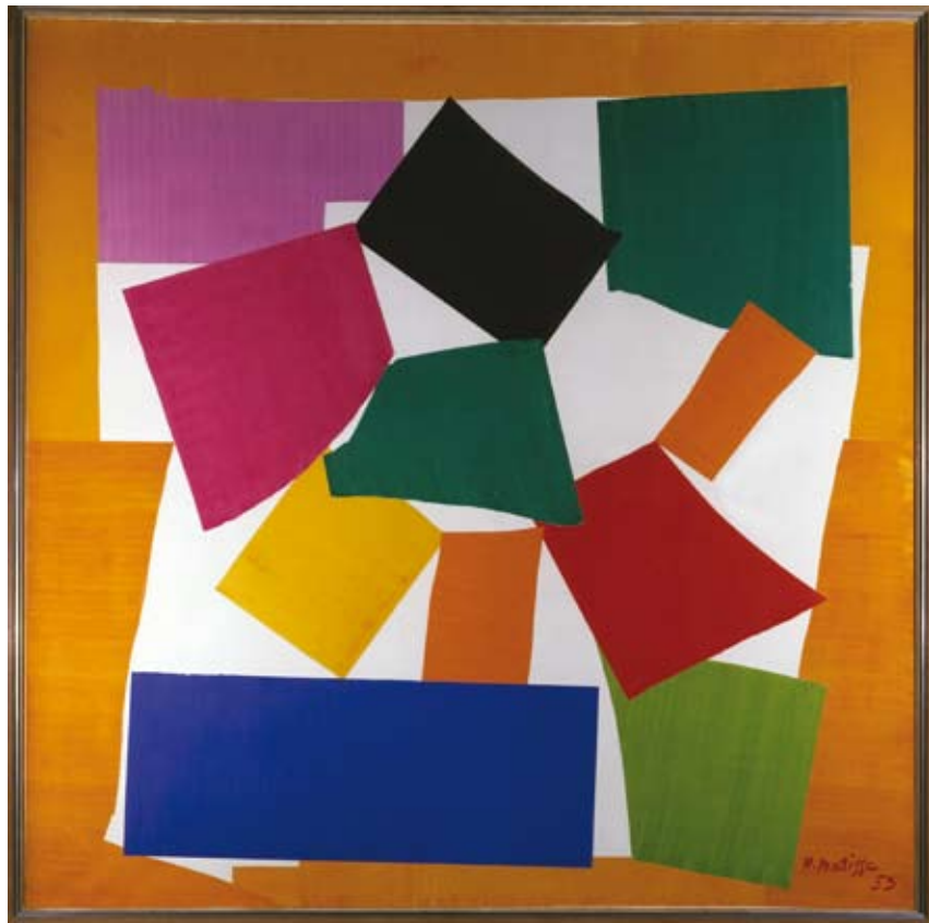
©Desc: L'Escargot. Artista: Matisse, Henri: 1869-1954: francés