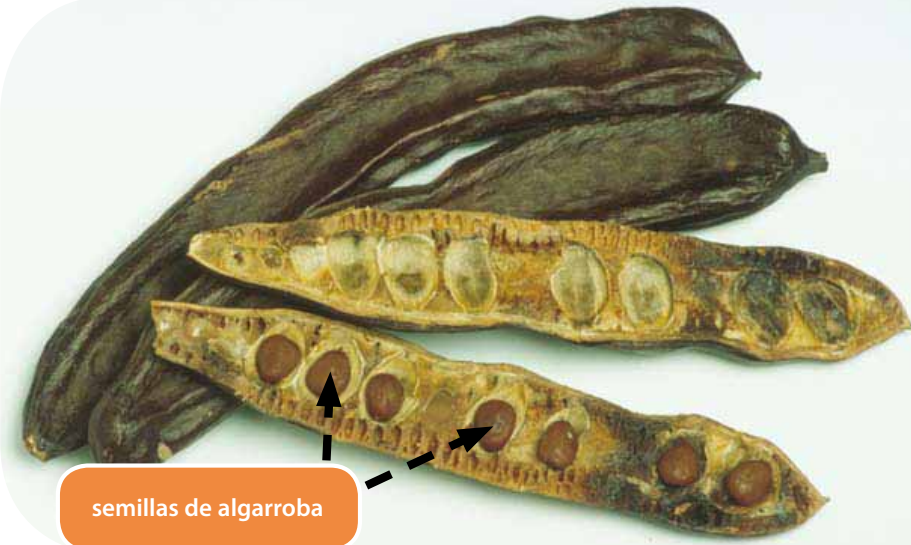
semillas de algarroba

El oro y los diamantes aún hoy se miden en quilates. Hoy, un quilate pesa 0.2 gramos.